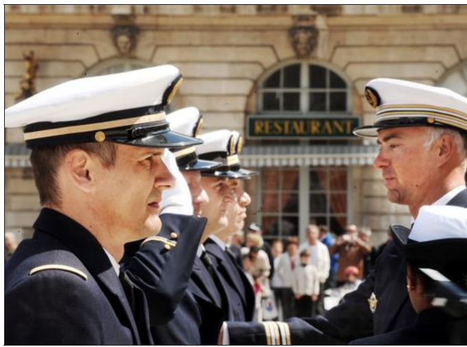
■ Médaillés sur les rangs hier.